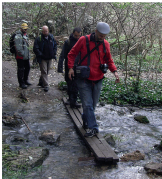
Suchou nohou p es vodopády