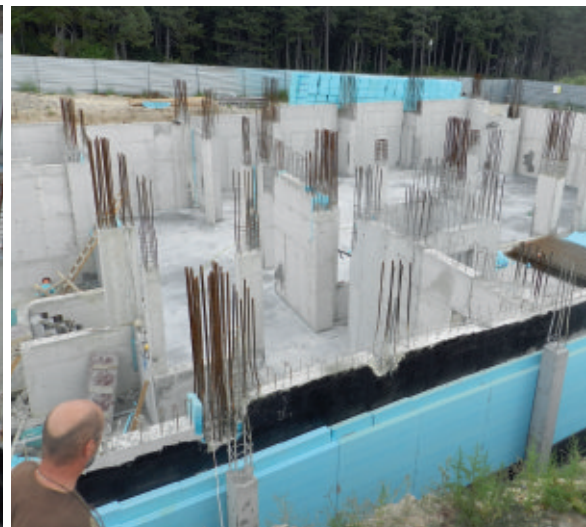
Práce se přesunuly na novou úroveň - z podlah na stropy.