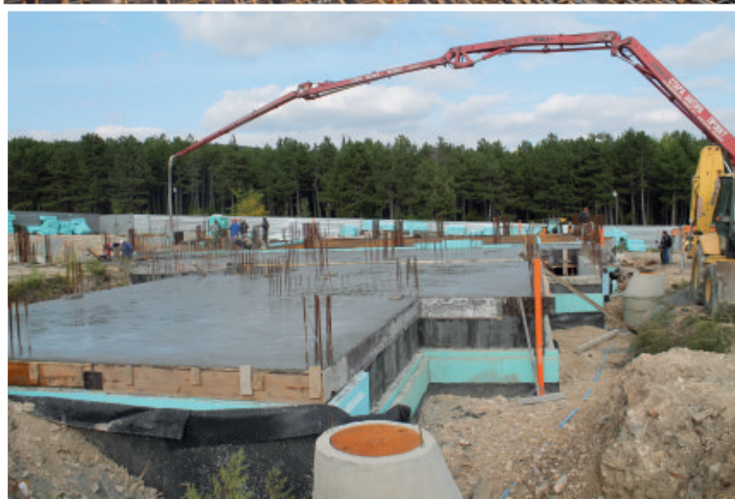
Beton a beton, tentokrát pouze 120 m 3 .