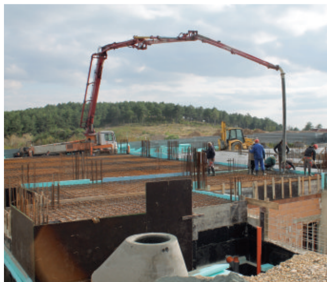
Výztuže a výztuže, doufáme že to vydrží i zemětřesení.