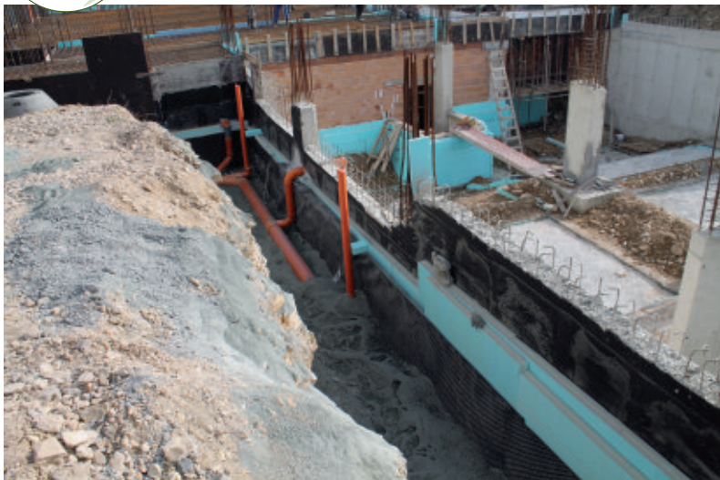
S betonáží podlahy stědiška, o které jsme psali v minulém čísle, byla položena i vnější kanalizace.