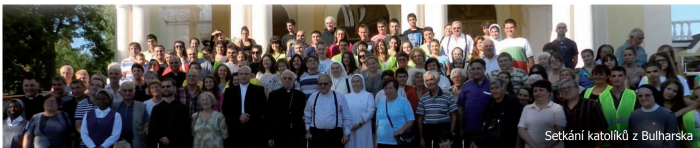
Setkání katolíků z Bulharska