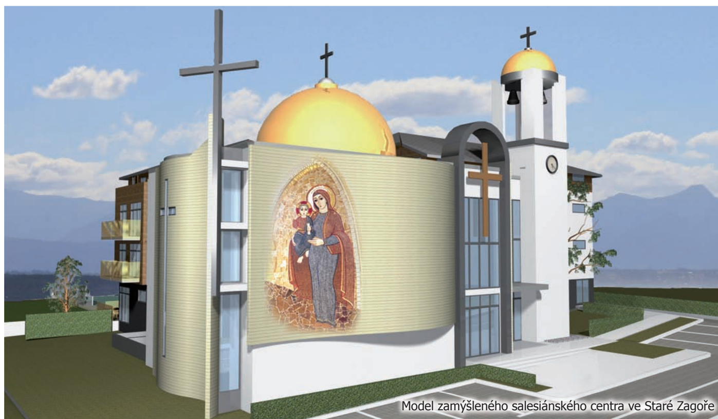
Model zamýšleného salesiánského centra ve Staré Zagoře

Stavbu nového střediska a kostela můžete podpořit přes www.bulharsko.sdb.cz/zapojte-se